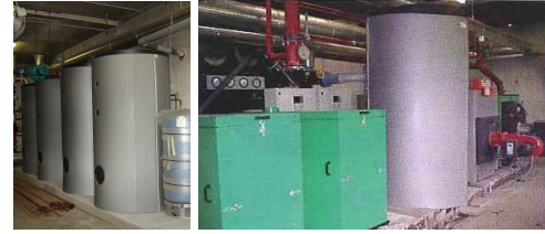
les ballons de stockage solaire (photo de gauche) les 2 cogénérateurs et la chaudière à condensation (photo de droite)